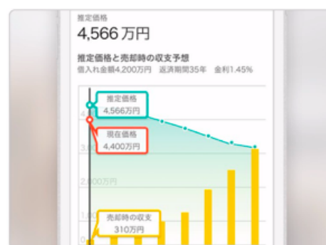
マンション推定価格の表示例