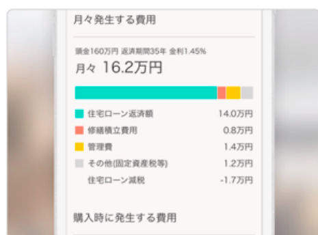
月々発生する費用の算出例

また、マンションの売却についてもZoomなどを用いてオンラインでの相談を承っています。